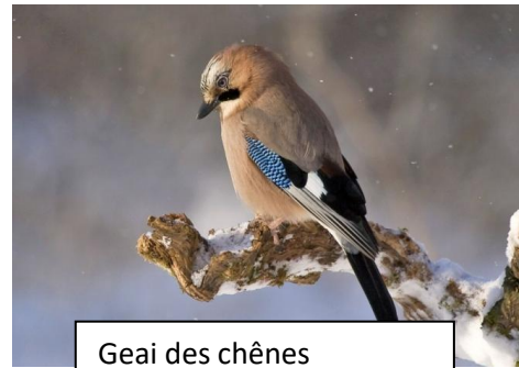
Geai des chênes