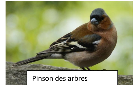
Pinson des arbres